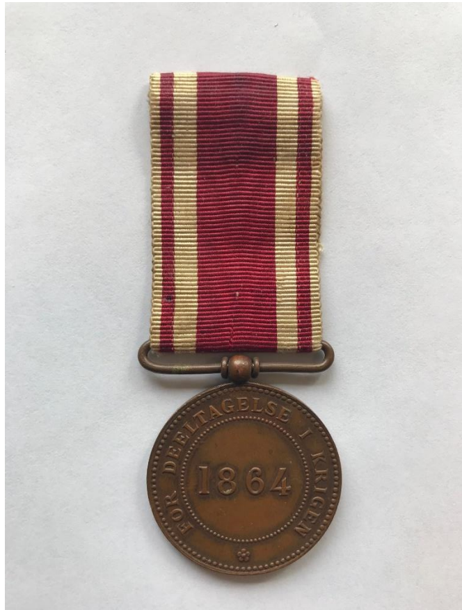
En erindringsmedalje for 1864-krigen.