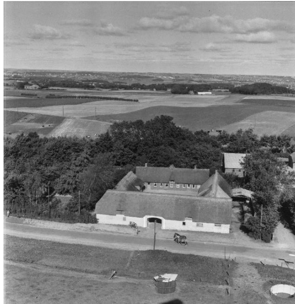
Luftfoto fra 1954 I baggrunden marker mod Viby.

Ejendommen lå nord for Sletvej. I dag er der kun stuehuset tilbage.